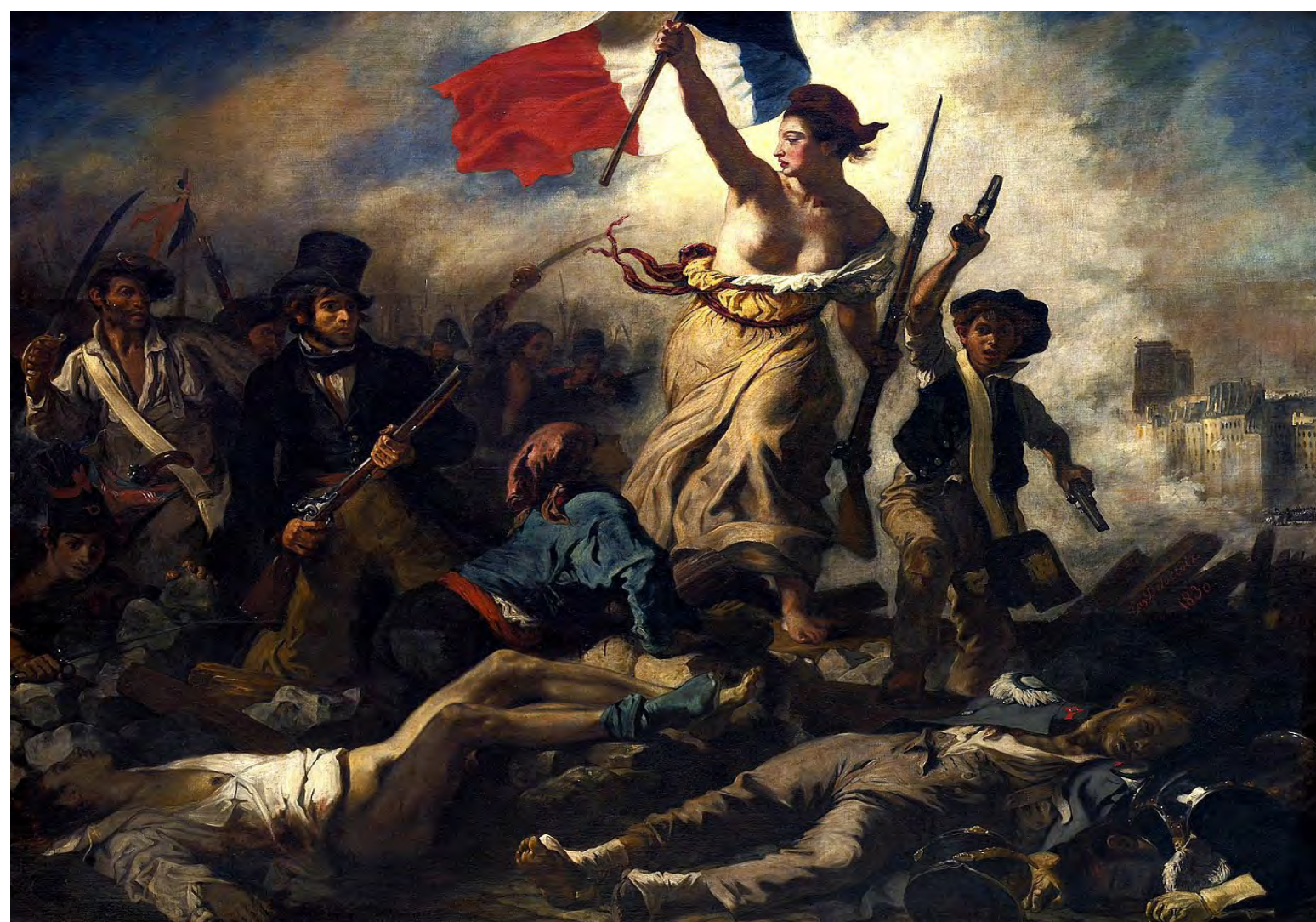
La Liberté guidant le peuple, tableau d'Eugène Delacroix (1830).