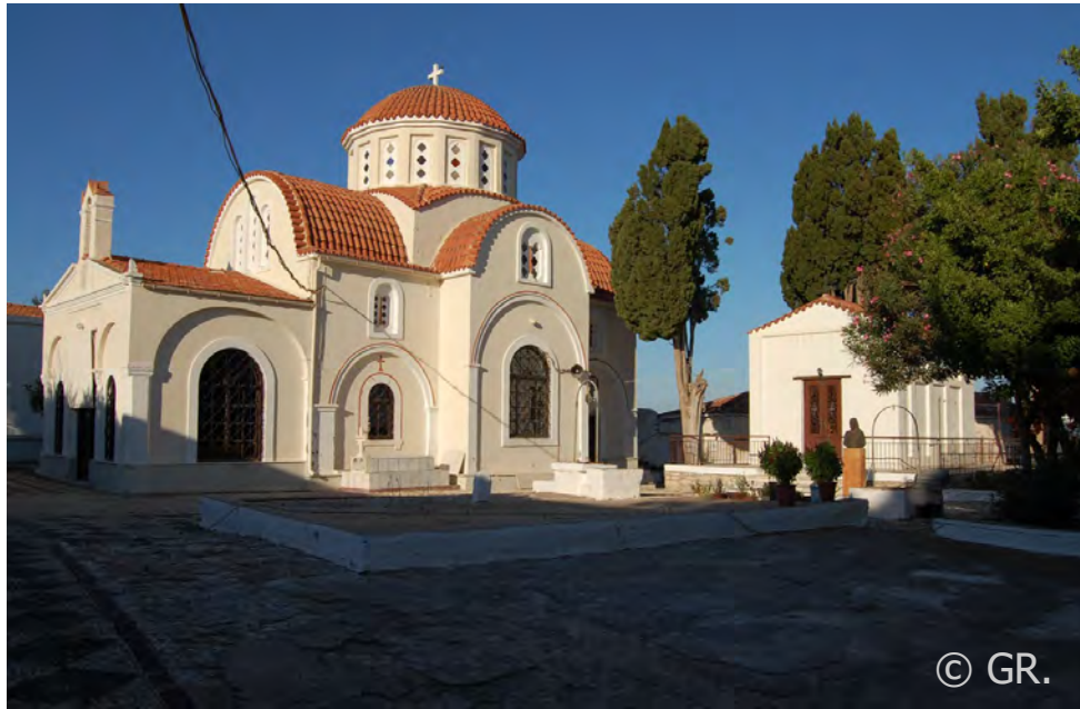
Monastère Néa Moní, Chios.